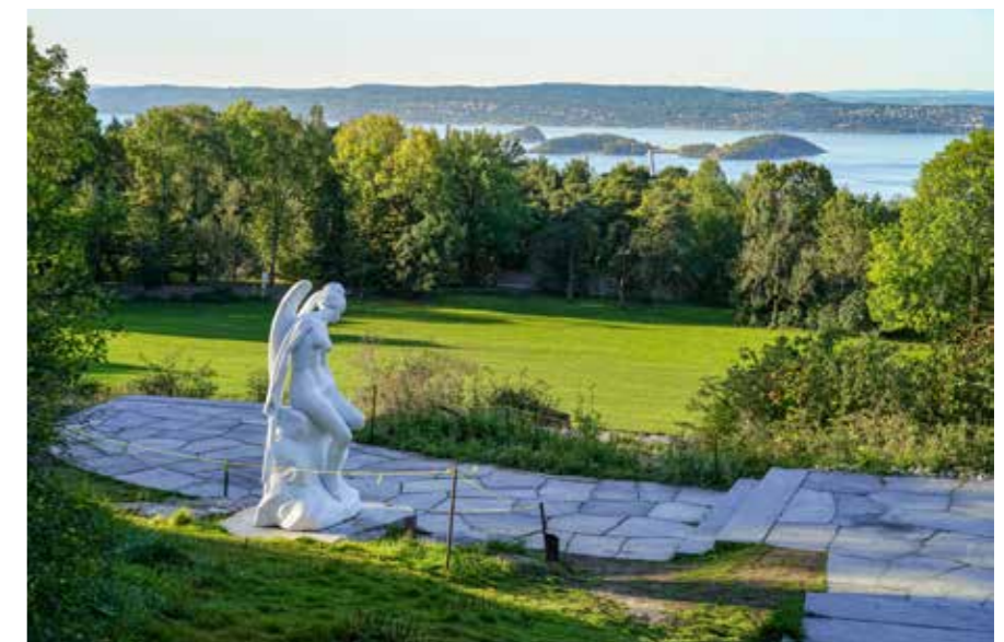
"האנטומיה של המלאך". פסל משיש קררה של האמן הבריטי דמיאן הירסט, בפארק הפסלים אקברג, נורווגיה (2008).

הפך לבית מיון דואר ואחר כך הוסב לאתר צילום סרטים. במהלך שנות השבעים המבנה עמד בפני הריסה, אך ממשלת צרפת החליטה להפוך אותו למוזיאון. יש כאן כ-20 אלף מ"ר של שטחי תצוגה, ובהם יצירות אמנות צרפתית של תנועות האימפרסיוניזם והפוסט-אימפרסיוניזם מהמחצית השנייה של המאה ה-19 ותחילת המאה העשרים. במקום מוצגות יצירות מופת של האמנים הגדולים ביותר, ובהם קלוד מונה, פול סזאן, קאמי פיסארו, אדגר דגה, אוגוסט רנואר,