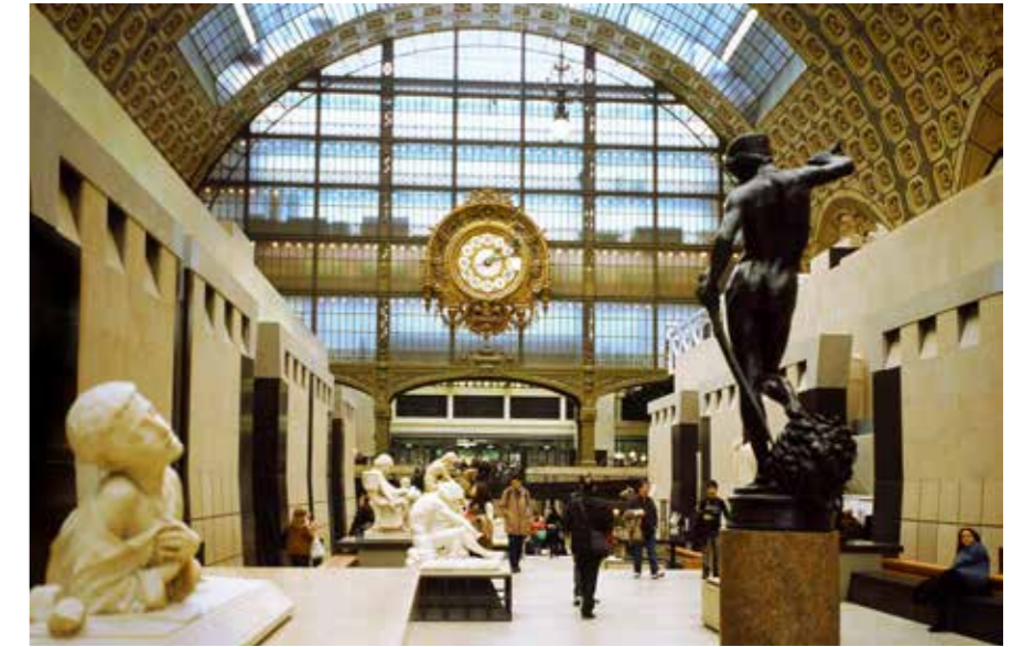
האולם המרכזי ב-Musée d'Orsay, המציג יצירות אמנות של האימפרסיוניזם והפוסט-אימפרסיוניזם. ברקע: השעון הגדול של תחנת הרכבת הישנה.