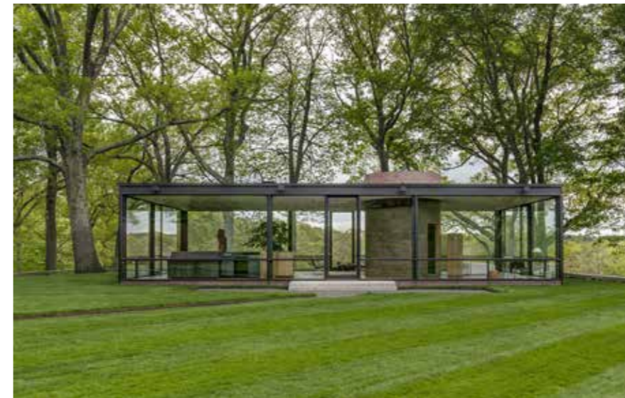
בית הזכוכית של פיליפ ג'ונסון בקונטיקט, ארצות הברית. בית מגורים מינימליסטי מזכוכית ופלדה, שנבנה בסוף שנות ה-40 והפך למוזיאון קטן לחובבי אמנות ואדריכלות.

כדוגמאות למבנים שייעודם המקורי לא היה קשור לאמנות אפשר לציין, למשל, את הטייט מודרן המפורסם בלונדון, שפעל עד שנות ה-80 כתחנת כוח לייצור חשמל; את ה-Dia Beacon מחוץ למנהטן, אשר שימש בעבר מפעל להדפסות וכיום מציג אמנות משנות ה-60 ועד ימינו; ואת הקינדל (Kindl) בברלין, שהיה פעם מבשלת בירה. הנה עוד כמה דוגמאות מעניינות.