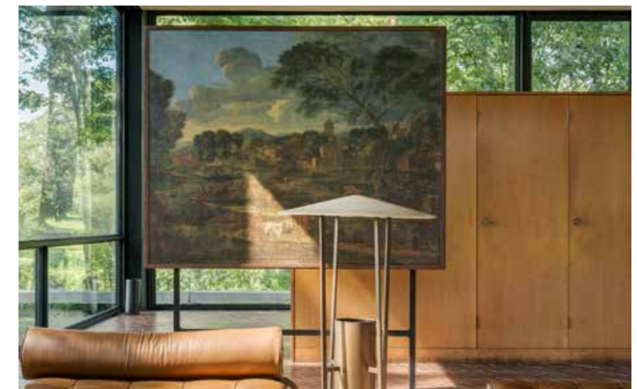
במרכז הסלון המעוצב והשקוף בבית הזכוכית ניצב על כן ציור נוף מהמאה ה-17 של הצייר הצרפתי ניקולא פוסון.

ג'ונסון הקים את המחלקה לעיצוב ואדריכלות ב-MOMA ניו יורק ב-1946 ונחשב אחד האדריכלים החשובים במאה העשרים. הוא התגורר בבית הזכוכית במשך 58 שנים