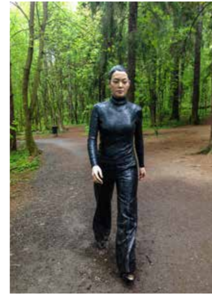
פסל "אישה הולכת" מברונזה צבועה, בגודל טבעי, של הפסל האנגלי שון הנרי, ממוקם בשכיל הליכה בפארק אקברג (2010).