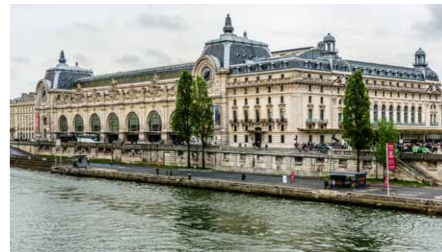
Musée d'Orsay, תחנת רכבת ישנה על הגדה השמאלית של הסן בפריז, שהפכה למוזיאון ובו יצירות מופת של האמנים הגדולים ביותר.

מס מוקה הוא אחד המרכזים הגדולים לאמנות עכשווית בארצות הברית. המקום נבנה במאה ה-19 כמתחם תעשייתי באזור צפון אדמס שבמסצ'וסטס. בשנים 1860-1942 שימש כבית חרושת בשם "ארנולד מפעלי דפוס", שהיה אחד המפעלים הגדולים בעולם להדפסה על