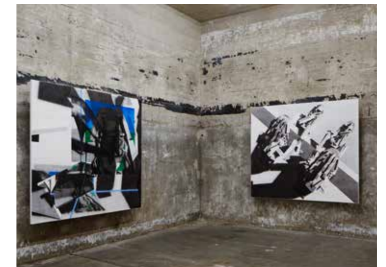
ציורים מופשטים של האמנית אורי זינגר על קירות בטון חשופים בבונקר ברוס, ברלין, 2015.

למיקום ולצורה שבהם מוצגות יצירות האמנות יש תפקיד מכריע באופן שבו הצופים חווים את היצירה עצמה, ומעניין לבחון עד כמה החלל החדש שמר על צביונו המקורי לאחר שהוסב לחלל אמנות. במקרים רבים, בחללים אלה נשמר המראה התעשייתי, עם רצפת בטון וקונסטרוקציית ברזל חשופה - ניגוד גמור לאסתטיקה של הקובייה הלבנה.