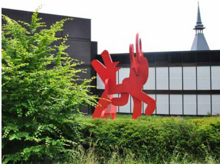
פסל חוץ של קית' הרינג בנינת מלון Dolder Grand

מציע חוויית נופש יוצאת דופן, מותאמת לתחום העניין של האורח. מבין כל אלה, אחד הקונספטים האהובים הוא של בתי המלון שקסמם האמיתי טמון בשילוב יצירות אמנות כחלק בלתי נפרד מהעיצוב. מעבר לתפקידה האסתטי, האמנות כאן יוצרת חוויית אירוח תרבותית, יוצאת דופן, המקבילה לביקור בגלריה או מוזיאון. יצירות אמנות בסוגי מדיום שונים - ציור, פיסול, צילום, וידיאו ארט ועוד - המוצגות ברחבי המלון, משדרגות את החלל ומוסיפות לאווירה ולעיצוב נופך דרמטי, יצירתי ולא שגרתי. מלונות אמנות רבים מציעים לאורחים עוד ערך מוסף, של פעילויות ותכנים אמנותיים כמו תערוכות מתחלפות, הצגת אוספים, ספרים ומגזינים בנושאי אמנות, הרצאות וסדורים מודרכים להכרת היצירות