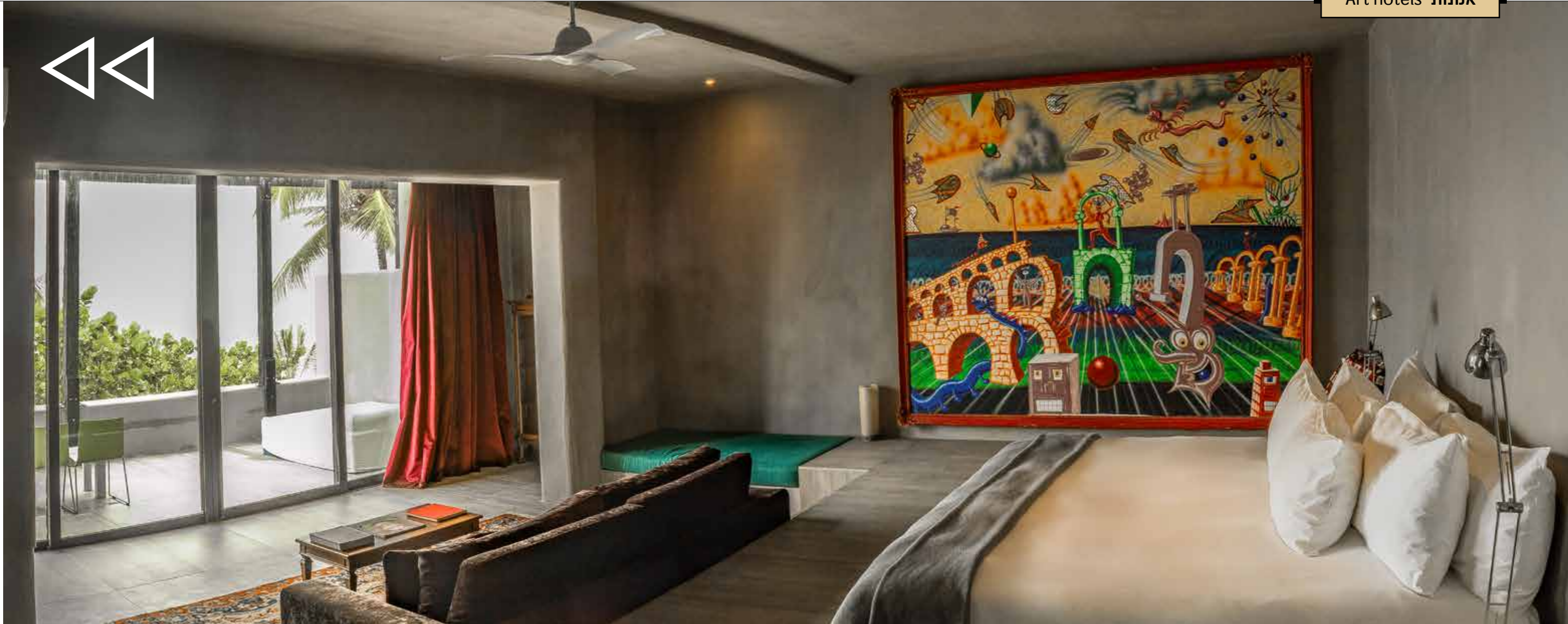
ציור שמן גדול וצבעוני מעטר את הסוויטה המפנקת במלון Casa Malca, מקטיקו