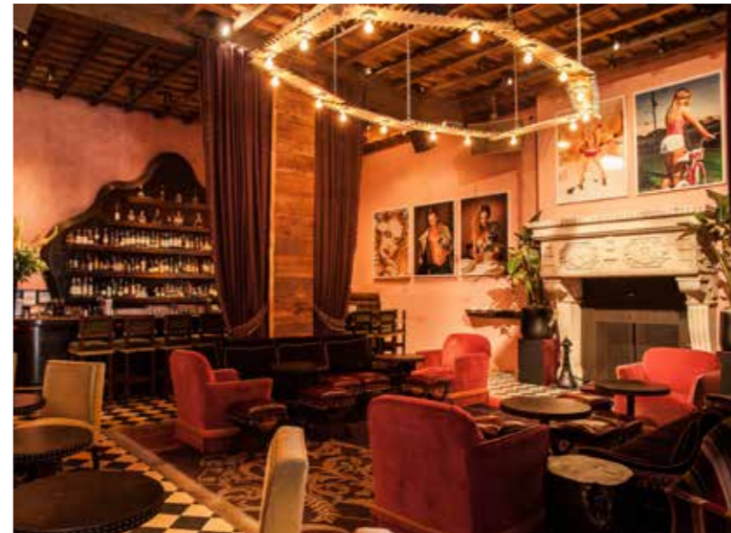
עבודות צילום של האמן David LaChapelle, כבר של Gramercy Park Hotel