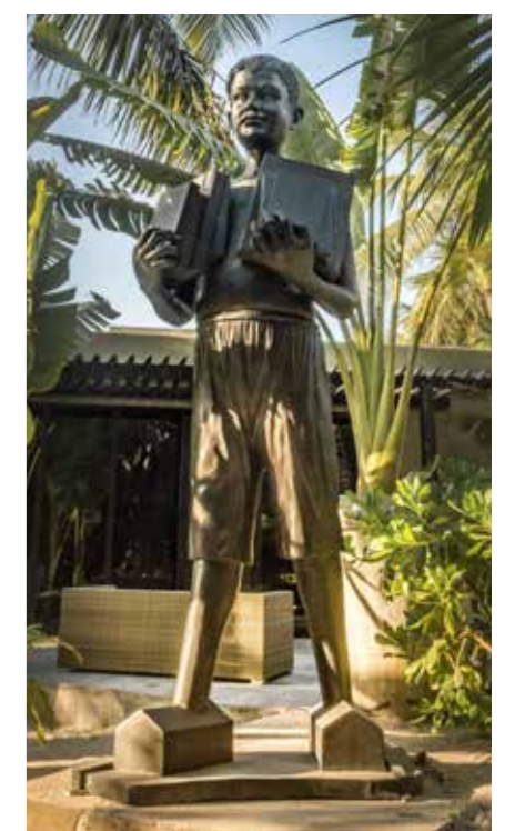
פסל מונומנטלי של Jitish Kallat בחוף של Casa Malca

מלון דולדר גרנד נראה כמו טירה קסומה מהאגדות. הוא נבנה לפני 120 שנה על גבעה הצופה על העיר צ'ריך ועל