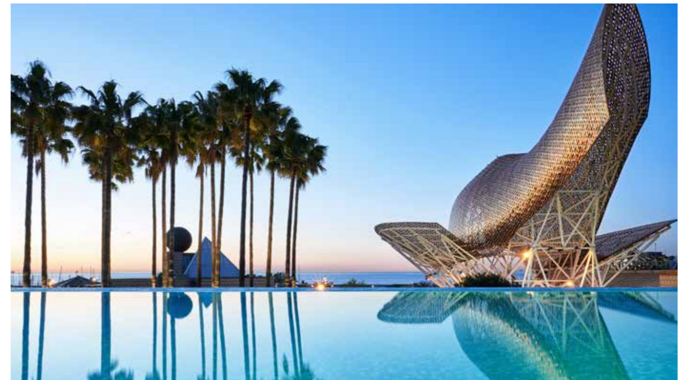
"הדג" - פסל באורך 56 מטר בעיצובו של האדריכל פרנק גרי, ממוקם ליד בריכת Arts Hotel ברצלונה