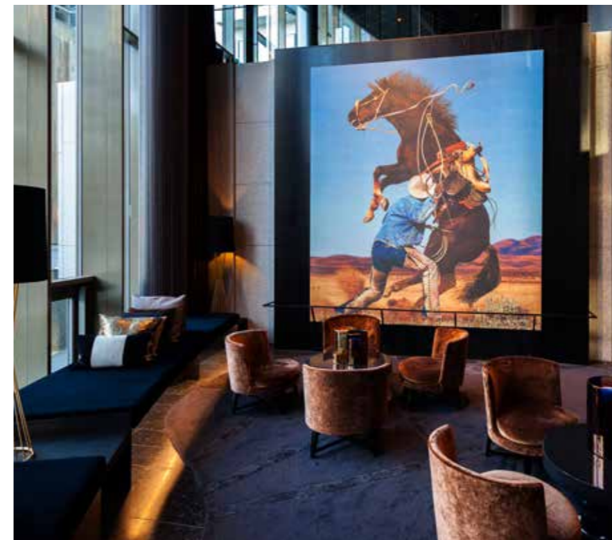
תצלום אמנותי של קאובו, יצירה מאת ריצ'רד פרינס בלובי של מלון The Thief, אוסלו