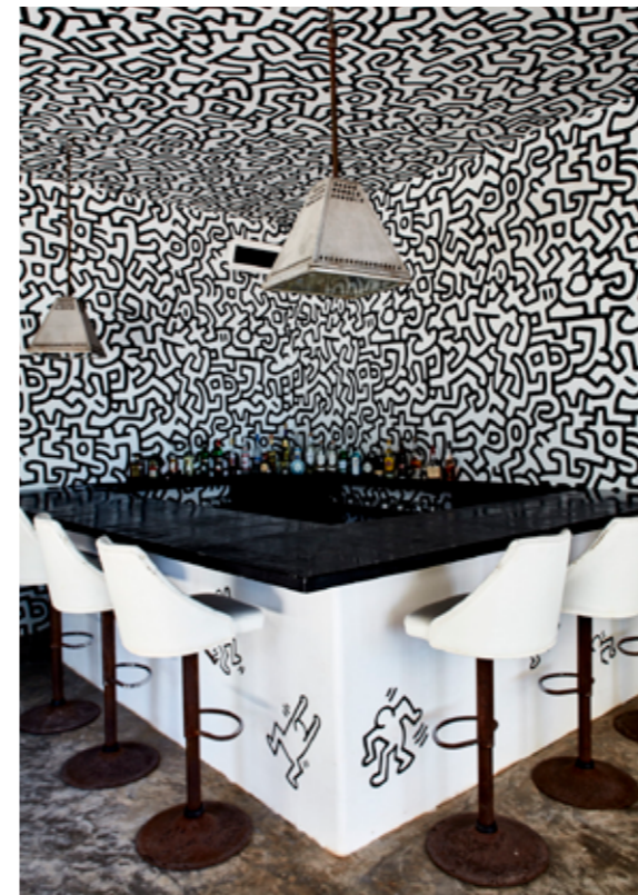
צ'ור שחור-לבן של האמן קית' הרינג בלובי-בר של מלון Casa Malca