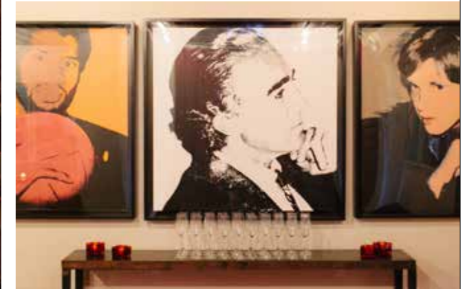
יצירות של אנדי וורהול בלובי של Gramercy Park Hotel, ניו יורק

והוא אשר בחר יצירות מקוריות לכל אחד מ-119 החדרים ותערוכות מתחלפות בחללי המלון הציבוריים - יצירות של אנדי וורהול, צ'ארלס ריי, ריצ'רד פרינס וסר פיטר בלייק. עבודות וידיאוארט של האמן