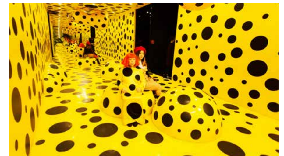
האמנות היפנית יאיו קוקקה מפייעה בעצמה בחוך מיצב הנקודות האינסופיות - מוטיב שהפך לסמלה האמנותי

המאפיין הראשון של אמנות עכשווית מתייחס לתקופה שבה היא נוצרה - החל מהמחצית השנייה של המאה ה-20 ועד היום. מאפיין נוסף מתייחס לאופי הפלורליסטי של היצירה העכשווית. הודות לחידושי הטכנולוגיה המודרנית אנו עדים לשימוש בחומרים מהתעשייה כמו פלסטיק, חומרים פולימריים, דבקים, אלומיניום, ובטכניקות מעורבות המשלבות ביניהם. גם המהפכה הדיגיטלית השפיעה דרמטית על עולם האמנות, כאשר התפתחו טכניקות נוספות בנוסף לצילום, כמו ציור דיגיטלי על מחשב/ אייפד, ודיאורט שהפך ללהיט בעידן שלנו,