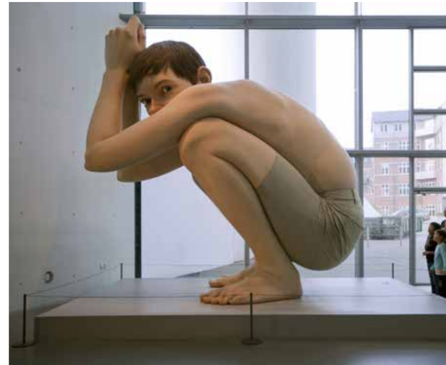
פסל היפר ריאליסטי, "ילד", בנבנה חמישה מטרים, של האמן רון מויצק (מוזיאון ארוס, דנמרק)

*** סוד הקסם של האמנות העכשווית הוא שילוב אקלקטי מעניין של זרמים, טכניקות ומדיומים. נראה כי בעתיד האמנים ימשיכו לאמץ את האפשרויות החדשות שהטכנולוגיה פותחת בפניהם וליצור אמנות מעוררת השראה ופורצת דרך.