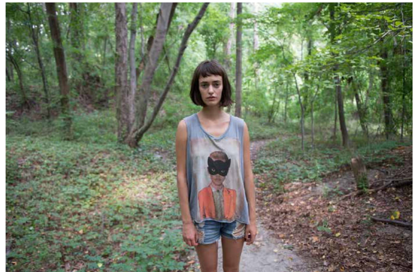
"Olya": ציור שמן פוטוריאליסטי הנראה כמו צילום. מאת האמן הישראלי יגאל עוזרי, 2015. צילום: באדיבות גלריה קורידור

מיצג הוא מופע המשלב מדיות שונות מתחום אמנות הבמה, כמו תיאטרון, שירה, מחול, צליל, וידיאו. המיצג מבוצע מול קהל בזמן אמת, ולפעמים הוא מזמין את הצופים להשתתף בפעילויות מסוימות על מנת להפנות את תשומת לבם למשמעויות חדשות וחתרניות, כדרך לערער ולבקר את הסדר הקיים. מדובר באירוע אמנות חולף, המשאיר אחריו רק את זיכרון החוויה. כמדיום אמנותי, המיצג נולד בתחילת