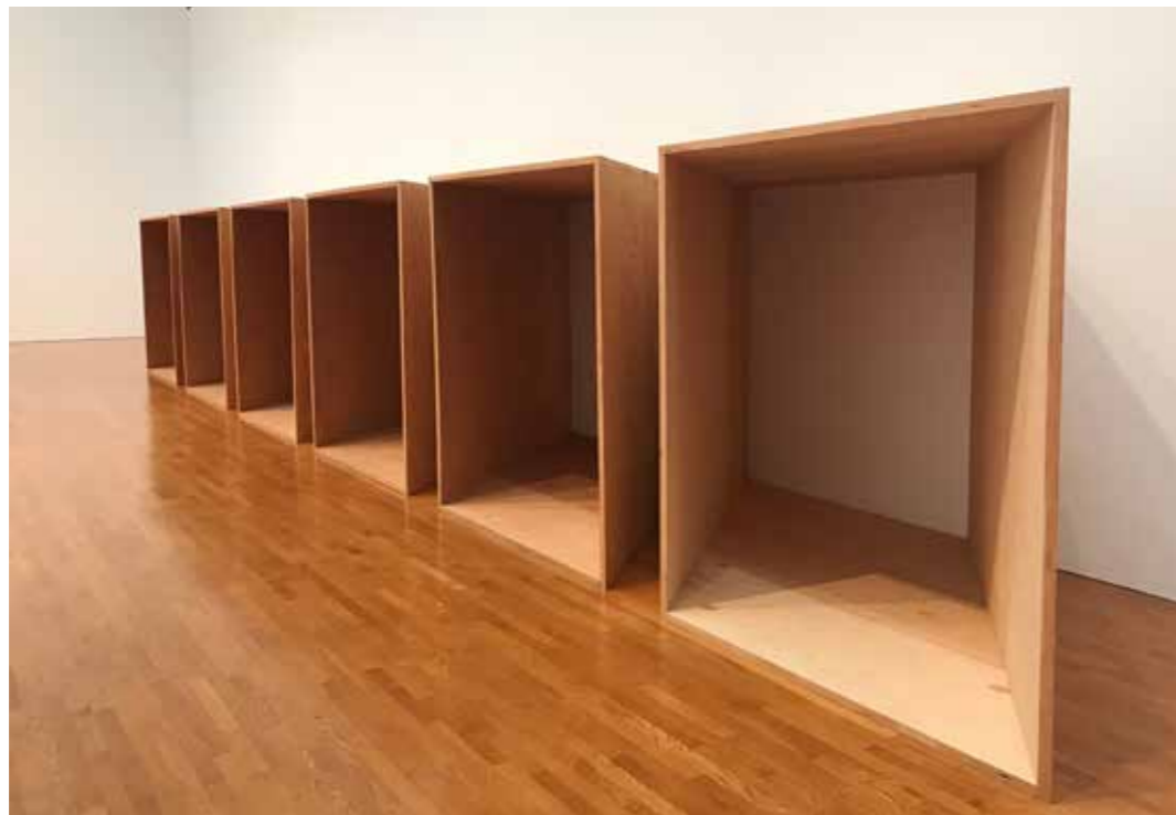
עבודה מינימליסטית של האמן דונלד ג'אד, המורכבת מצורות גאומטריות תלת־ממדיות (הגלריה הלאומית באוטווה, קנדה)

שעות נתנה לצופים לעשות בה כרצונם, כשהיא פסיבית לגמרי. במיצג אחר היא ישה עם אהובה, האמן אוליי לאיסיפן, זו מול זה כשהם סוטרם אחד לשנייה בעוצמה הולכת וגוברת או, לחלופין, כשהם יושבים 17 שעות גב אל גב כששיערם שזור זה בזה בצמה.