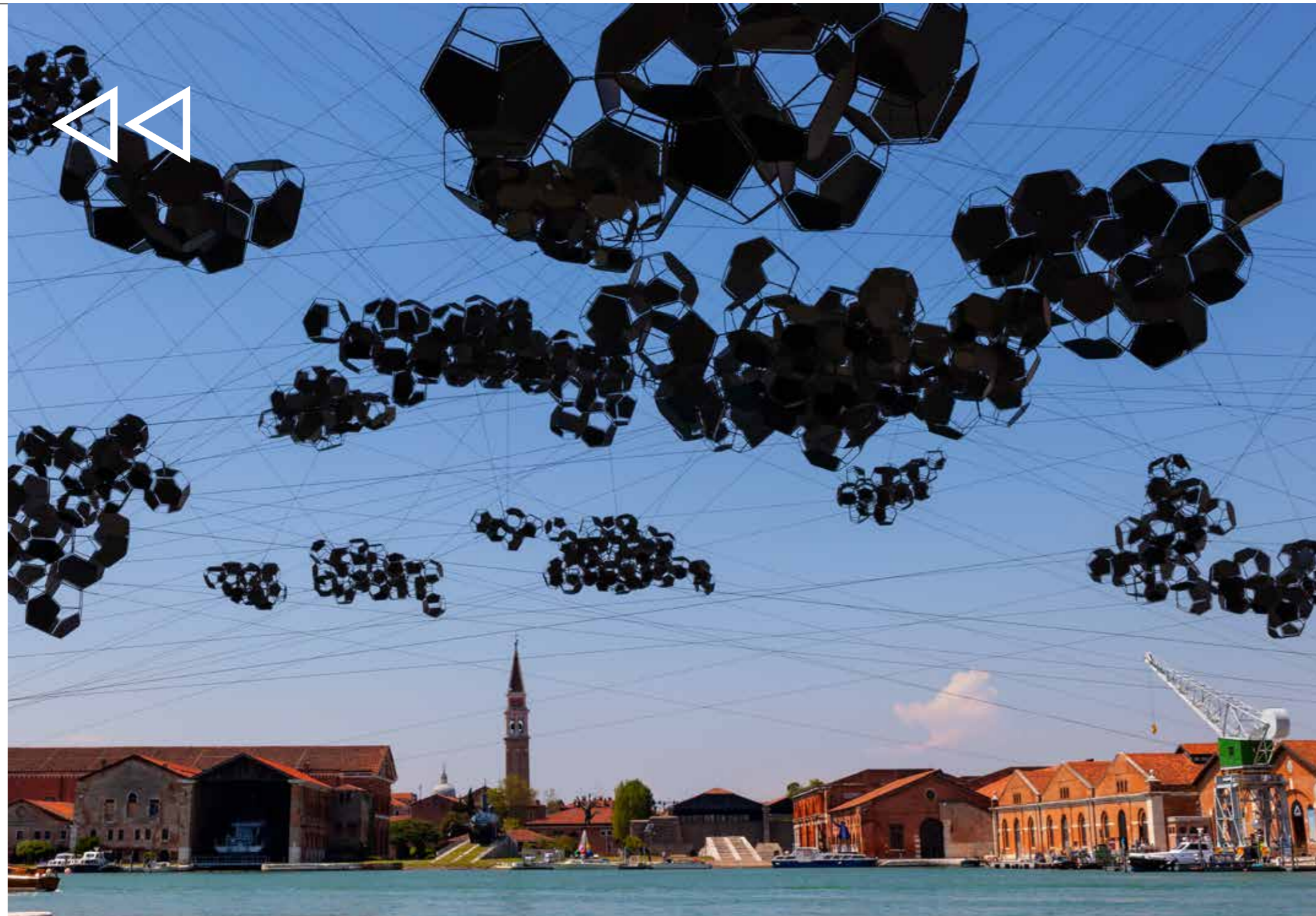
מיצב חוץ של האמן הארגנטיני תומס סרְקְנו, שהוצג בביאנלה לאמנות בונציה, 2019

אמני מיצב בולטים נוספים בעולם הם מוֹנֶה חאטום, אולאפור אֶלִיאָסון, כריסטיאן בולטנסקי, ארס פִּישר, שילפה גופטה, ויש עוד רבים אחרים.