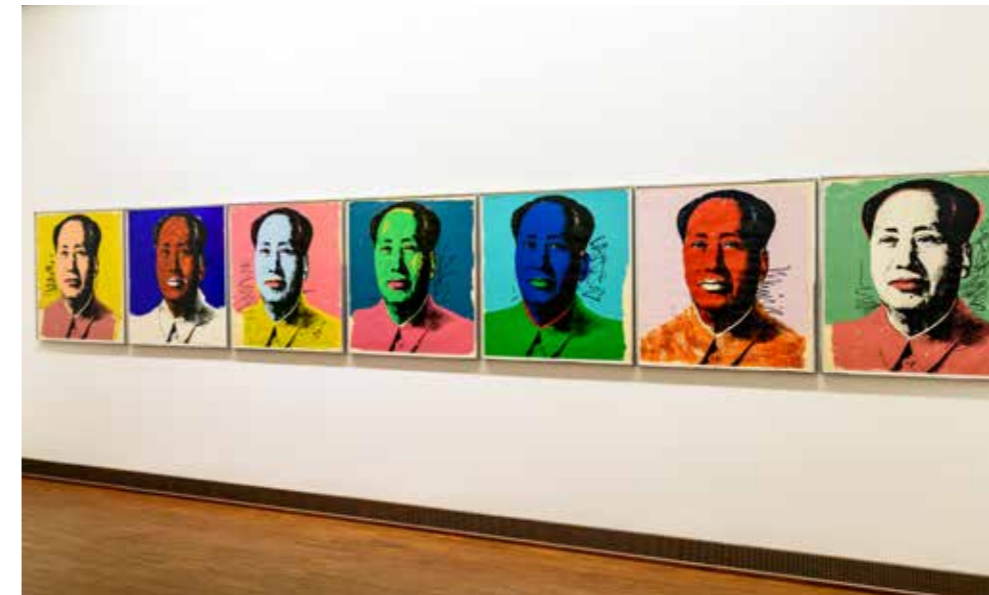
דיוקנאות "מאו צה טונג" של אנדי וורהול, שהוצגו במוזיאון אלברטינה בוינה ב־2015

אמני הפופ־ארט טשטשו את הגבול בין אמנות "גבוהה" ומסורתית לאמנות "נמוכה", וכל מוצר צריכה סתמי ויומיומי, כמו קופסת שימורים או בקבוק קולה, הפך ליצירת אמנות לגיטימית. בין הטכניקות שאמני הפופ פיתחו היו הגדלה, הגזמה ושכפול של דימויים, שימוש בצבעים חזקים ובוהקים והכנסת מילים, סמלים ולוגואים ליצירה. הם העריצו באופן אירוני את גיבורי התרבות הפופולרית, גיבורי הקומיקס כספיידרמן ובאטמן