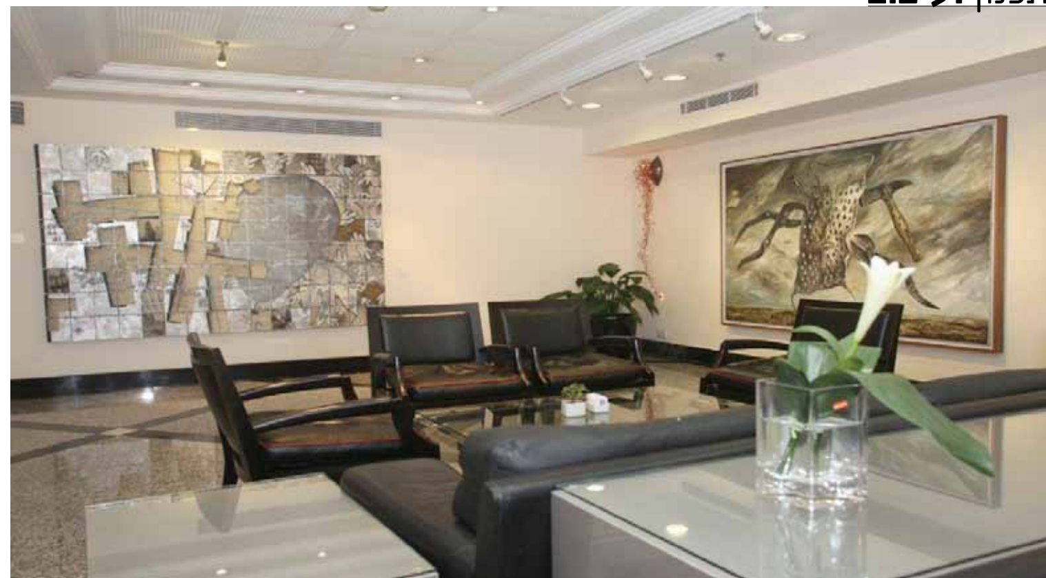
לובי במלון מרינה