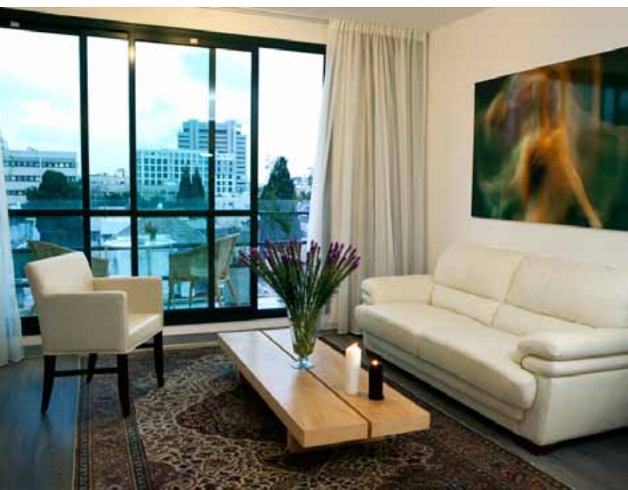
חדר אירוח במלון דיאגילב.