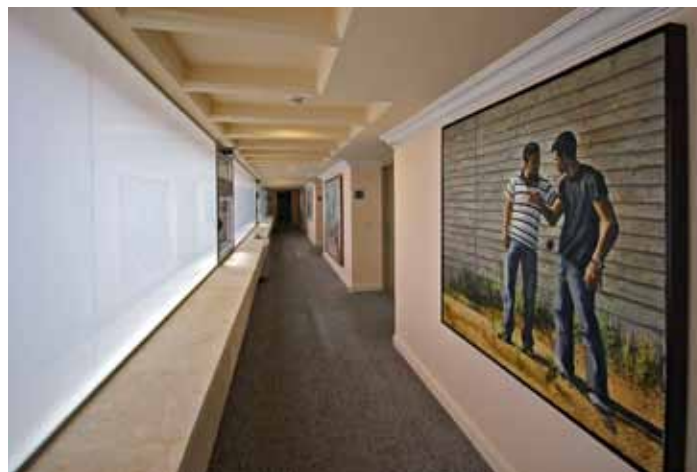
ציור שמן של האמן מתן בן כנען במלון מרינה תל אביב.