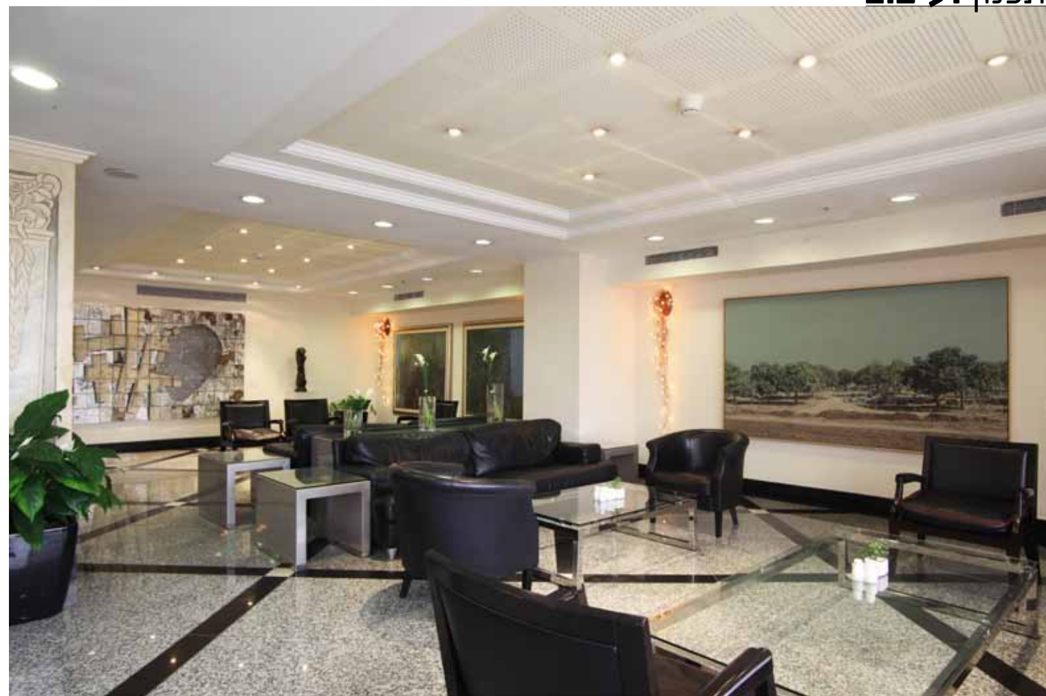
לובי במלון מרינה תל אביב. מימין: תמונת שמן של אלי שמיר "חורשת אלונים" 2008. באמצע: ציורים של עופר ללוש, בצד שמאל: "קליפת זמן", טכניקה מעורבת על אלומיניום של האמן זיגי בן חיים.

לסיכום ניתן לומר, כי אין ספק שיצירות אמנות המשולבות כחלק אינטגרלי מעיצוב המלון מציעות למתארחים חווית אירוח ייחודית המשולבת עם תכנים תרבותיים, ואפילו מקבילה משהו לביקור בגלריה או במוזיאון.