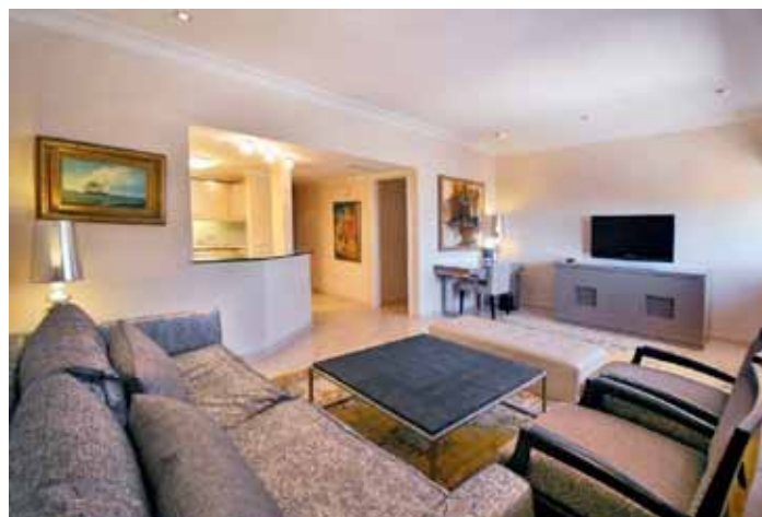
סוויטת במלון מרינה תל אביב.