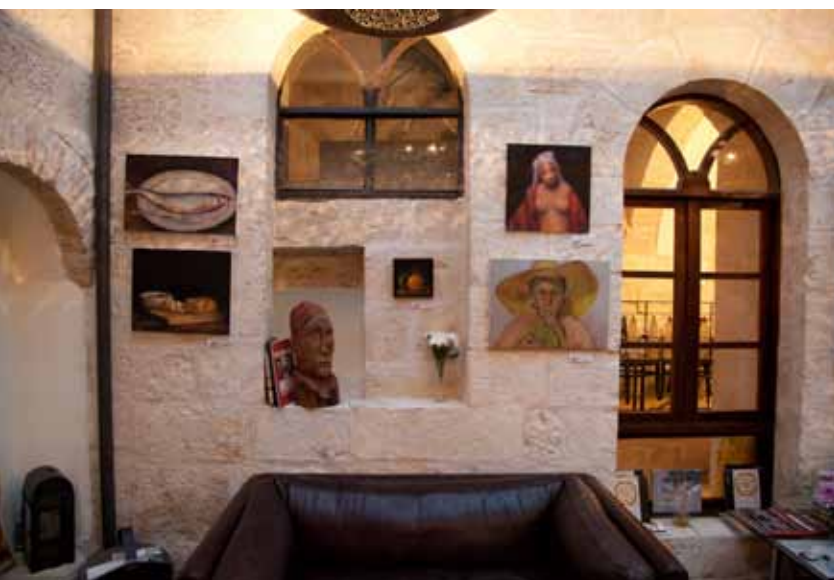
תערוכה של האמן יעקוב כרמלי בלובי מלון אלגרה.