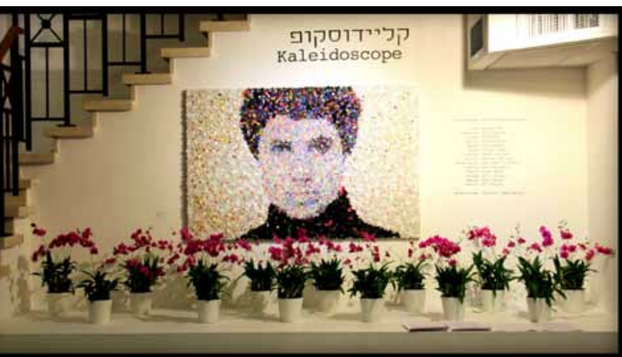
תערוכה נוכחית במלון דיאגילב - 'קליידוסקופ'