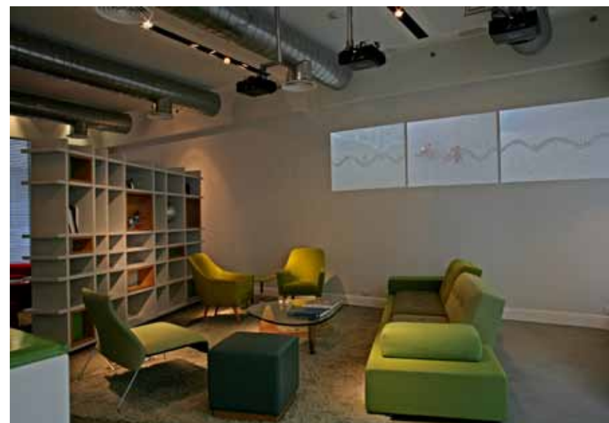
וידאו ארט של האמנית סיגלית לנדאו המוקרן על הקיר בלובי של מלון ארט פלוס.