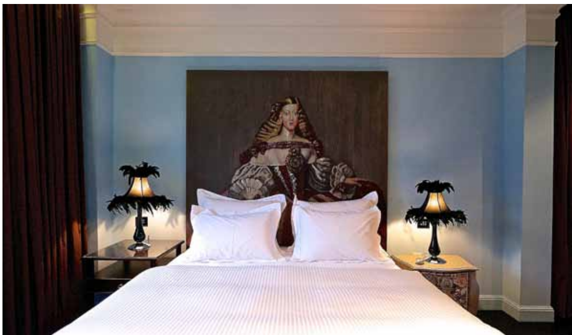
חדר שינה במלון עלמה: ראש מיטה עם ציור על עץ.